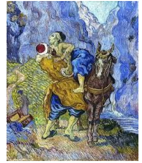
De barmhartige Samaritaan

Vaak zijn in situaties van armoede ook kinderen betrokken. Je kunt het meestal niet aan hen merken omdat ouders hen er zo goed mogelijk uit willen laten zien. Maar als het gezin langdurig afhankelijk is van een te laag inkomen wordt het zelfvertrouwen ernstig ondermijnt. Daarbij komt dat mens zich 'sociaal overbodig en uitgesloten' gaat voelen. Ook kinderen raken in een isolement, waardoor mogelijk leerprestaties en gedrag op school nadelig worden beïnvloed. Met alle negatieve gevolgen van dien naar de toekomst toe. Jan Monden