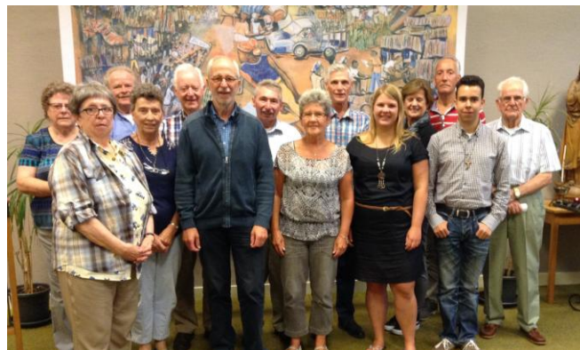
Van harte welkom ....

17.30 uur: Ontvangst 17.55 uur: Woord van welkom 18.00 uur: Gebedsviering 18.30 uur: Soep- + broodmaaltijd met gesprek 19.30 uur: Pauze: vertrek van de gasten 20.00 uur: Kerngroepoverleg 21.00 uur: Afsluiting